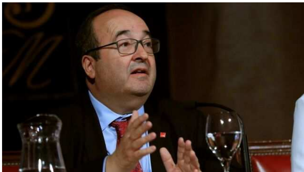
El primer secretario del PSC, Miquel Iceta, durante la conferencia sobre "El ideal federal" en el Ateneo de Madrid, presentada por el escritor y abogado Nicolás Sartorius.

El líder del PSC, Miquel Iceta, ha dicho hoy que aunque "no se den las condiciones para un gobierno de coalición", ello no debería ser "un obstáculo" para que en un futuro sea posible, y ha instado a Unidas Podemos "a dar luz verde" a la investidura de Pedro Sánchez buscando "camino con mayor confianza".